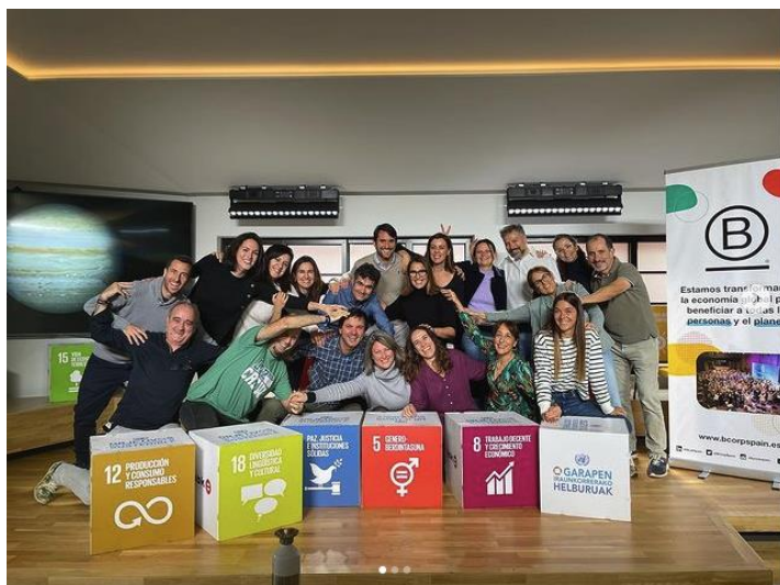
Imagen: participación en la formación BCORP, celebrada en Bilbao durante el mes de noviembre de 2022, para ser consultora acreditada